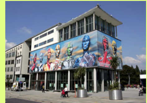
ARS Electronica Austria